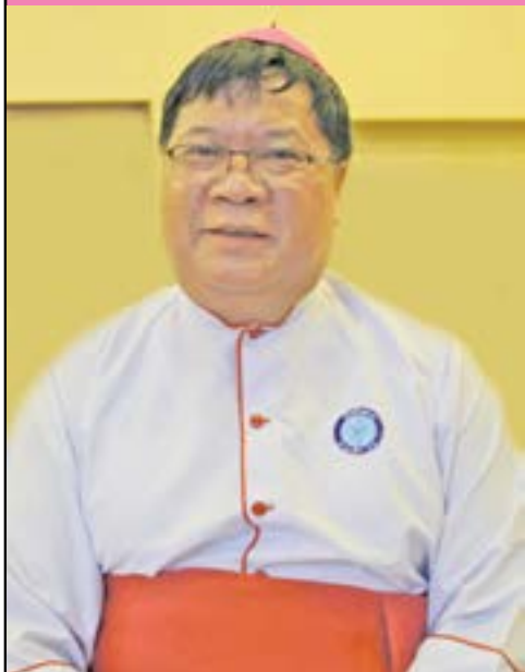
ဝိုက်ဆရာတော်ကြီး ဘာစီးလို့ အားသိုက် တောင်ကြီးသာသနာ ၂၂ ရက် ဇူလိုင်လ ၁၉၅၆ ခု