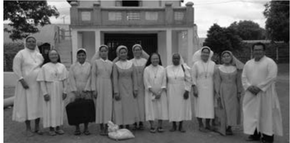
မြန်မာနိုင်ငံ ကက်သလစ်ဆရာတော်များ အဖွဲ့ချုပ် သတင်းဌာနယ်

အကြောင်း အမျိုးမျိုးကြောင့် ဤ စာမျက်နှာ(၁၄)သို့