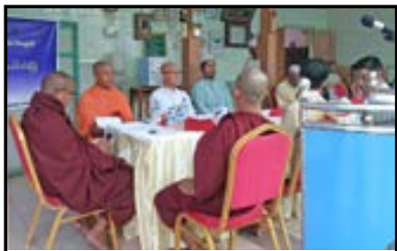
ဘာသာပေါင်းစုံ မိတ်ဆုံစားပွဲ နှင့် စုပေါင်း ဝါဖြေပွဲ အခမ်းအနား