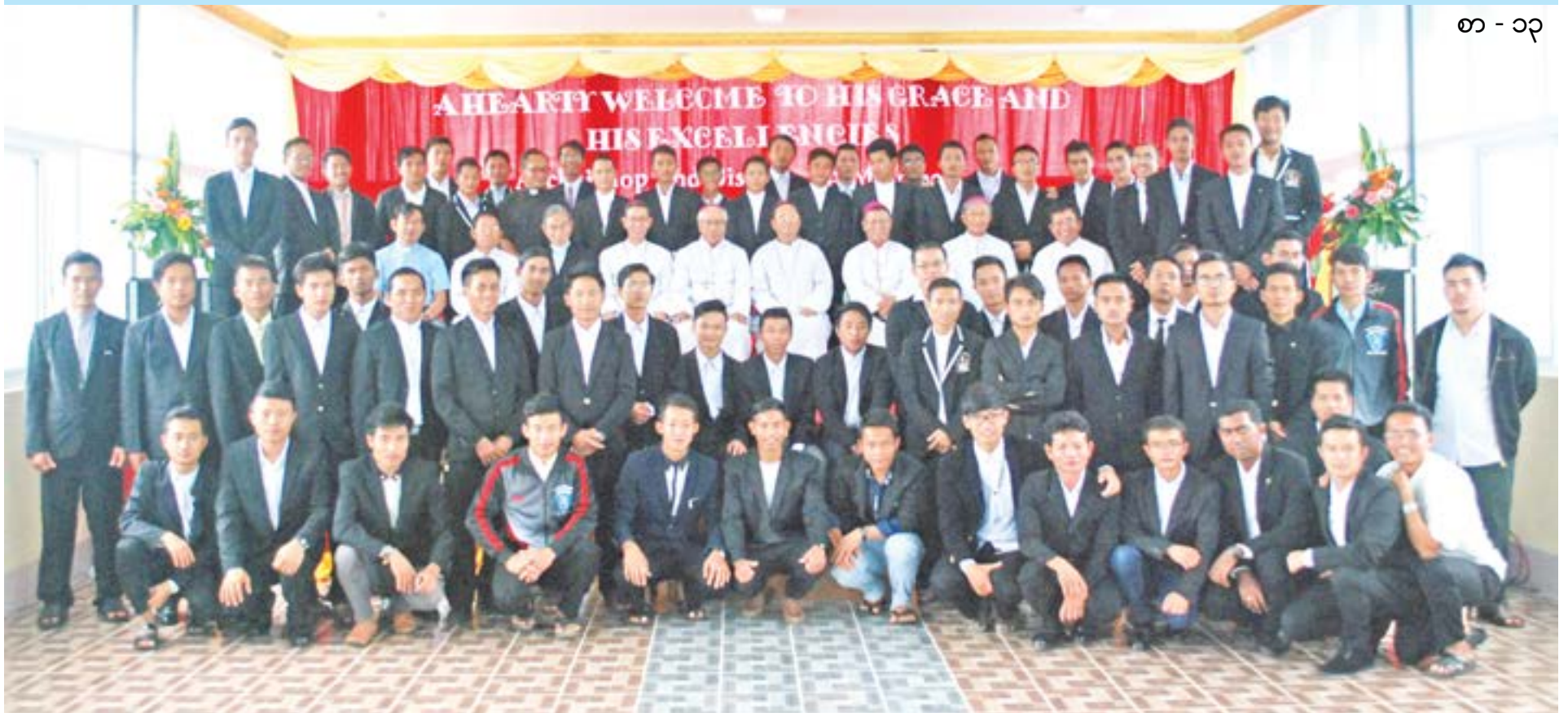
မြန်မာနိုင်ငံ ကက်သလစ်ဆရာတော်များ အဖွဲ့ချုပ် သတင်းဂျာနယ်