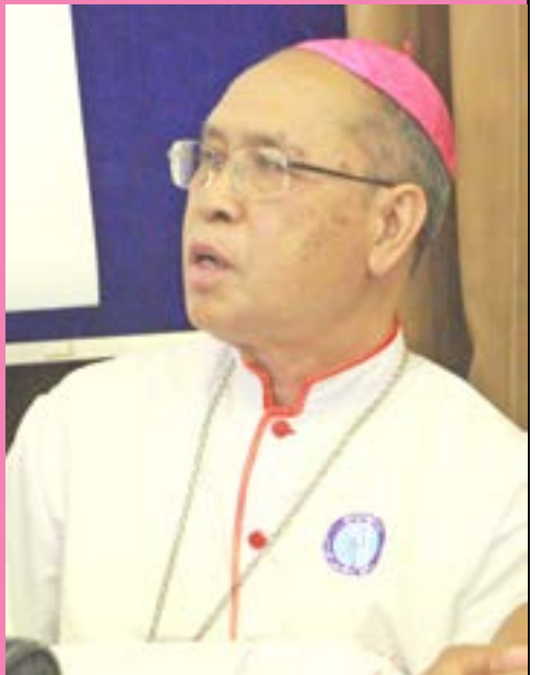
ဝိုက်အုပ်ဆရာတော်ကြီး အလက်ဇန္ဒား ပြုံးချို ပြည်သာသနာ ၁၀ ရက် ဇူလိုင်လ ၁၉၄၉ ခု

မွေးနေ့ရှင် ဆရာတော်ဘုရားများ ထာဝရဘုရားသခင်၏ ကျေးဇူးတော် အဖြာဖြာ နှင့် ပြည့်ဝကြလျက် ကိုယ်တော်ရှင်၏ အမှုတော်ကို သက်ဆုံးတိုင် ထမ်းရွက်နိုင်ကြပါ စေကြောင်း ဆန္ဒမွန်များစွာ ပြုလိုက်ပါသည်။