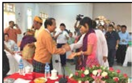
ကချင်ပြည်နယ်အစိုးရအဖွဲ့နှင့် ပန်းမော်ဝိုက်အုပ်သာသနာ တွေ့ဆုံခြင်း