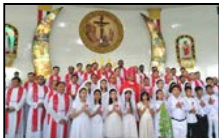
စိန်ပီတာ စိန်ပေါလ် ဘုရားရှိခိုးကျောင်း ပွဲတော်ကြီး