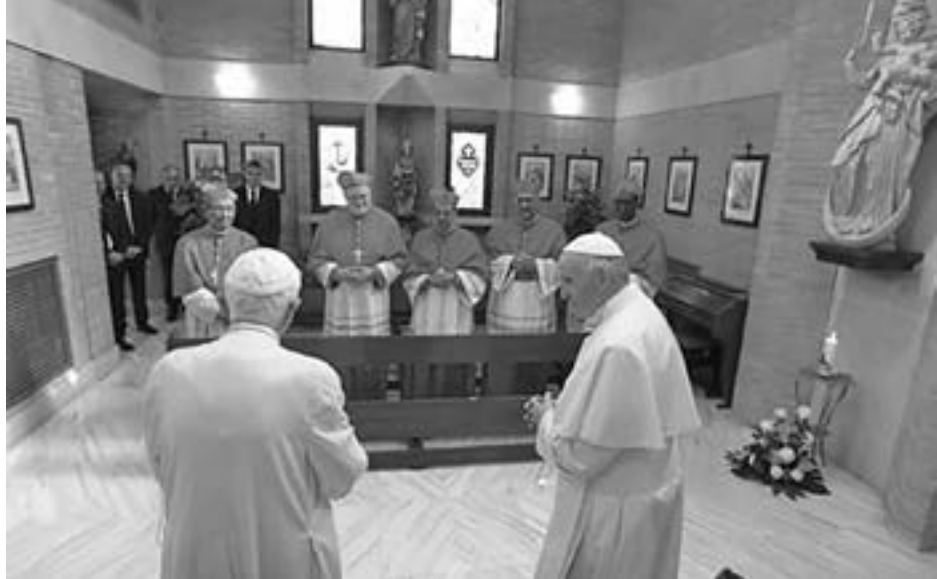
ကာဒီနယ်အသစ် ငါးပါးသည် အနားယူထားသော ပုပ်ရဟန်းမင်းကြီး ဘယ်နဒစ် ၁၆ အား ပုပ်ရဟန်းမင်းကြီး ဖရန်စစ်နှင့်အတူ သွားရောက် ဂါရဝမြို့ နှုတ်ဆက်ခဲ့ကြသည်။

စာမျက်နှာ ၃ မှ အဆက် ကား တိုင်ပေါ်က သားတော်ရယ်၊ ကားတိုင်ခြေရင်းက မယ်တော်ရယ် သားအမိ နှစ်ယောက်လုံး ခမည်းတော် ဘုရားရှင်ရဲ့ အလိုတော်ကို ငြိမ်သက်စွာနား ထောင်ခဲ့ကြပါတယ်။ သားတော်ရဲ့ နောက်ဆုံးအချိန်မှာ ကြောက်အား လန့်အားနဲ့ ထွက်ပြေးနေတဲ့ သူတွေကြားထဲမှာ သတ္တိရှိစွာ သားတော်နဲ့ အတူအားပေး ရပ်တည်ပေးခဲ့ပါတယ်။ အမိ မယ်တော်ဟာ ကားတိုင်ခြေရင်းမှာ ရပ်လျက်ရှိတယ်လို့ ကျမ်းစာက ဆိုထားပါတယ်။ ငိုကြွေးနေတယ်လို့ မဆိုထား ပါဘူး။ သားတော်နဲ့အတူရပ်လျက် ဝေဒနာတွေကို ပူဇော်ခံ ထမ်းပေးနေခဲ့တာပါ။ သုံးရက်မြောက်နေ့မှာ သားတော်ဟာ ပြန်ရှင်မယ်ဆိုတာကိုလည်း မသိသေးပါဘူး။ သားတစ်ယောက် ရဲ့ဝေဒနာကို ဝမ်းနဲ့လွယ်ပြီး မွေးခဲ့တဲ့ အမေက သာပိုသိပါတယ်။ သားကိုချစ်တဲ့စိတ်၊ ဘုရားကို သစ္စာရှိတဲ့ စိတ်တွေနဲ့ပဲ ကားတိုင်ခြေရင်းမှာ မျှော်လင့်ခြင်း ကြီးစွာ ရပ်နေ ခဲ့ပါတယ်။