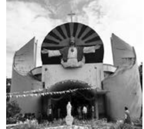
အင်းစိန်-RVA

ညိုမှိုပြီးပျံ့နှံ့သွားခဲ့တယ်။ သခင်ယေရှု့ရွှေ့နလုံးတော် ပုံတော်တွေမှာ ဆွဲထားတဲ့ နှလုံးတော်ပုံ၊ မီးလျှံပုံနဲ့ ဆူးရစ်ခွေတွေဟာ သခင်ခရစ်တော်ရဲက လူတွေအပေါ်မှာထားတဲ့မေတ္တာနဲ့ ပေးဆပ်ခဲ့ရတဲ့အချစ်တွေကို ဖော်ပြနေတဲ့အရာဖြစ်တယ်။ အားလုံးသတိယ ရမယ်။ သိရမယ်၊ နားလည်ရမယ် ဖြစ်တယ်။ ယေရှု့ရွှေ့နလုံးတော်ကို သဒ္ဓါကြည်ညိုခြင်းဟာ သခင်ခရစ်တော်ကို ရှိခိုးခြင်းနှင့် အတူတူပဲဖြစ်တယ် " ဟုဆိုကာ ၎င်းသာသနာရှိ ဘာသာတူများအား ယေရှု့ရွှေ့နလုံးတော်ကို ပိုမိုသဒ္ဓါကြည်ညို ကိုးကွယ်ကြဖို့ အားပေးတိုက် တွန်းကြပါပေးခဲ့ပါသည်။