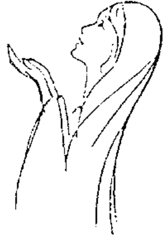
ဘုရား အသက်စွန့်ချိန်မှာတောင် ငြိမ်သက်စွာနဲ့ ကားတိုင် ခြေရင်းမှာရပ်နေခဲ့ပါတယ်။

တာတွေ ကောင်းကောင်းနားမလည်ခဲ့သော်လည်း တိတ် ဆိတ်စွာနဲ့ ဘုရားရဲ့ စကားကိုယုံကြည်ပြီး အရာရာကို နှလုံး သွင်းနိုင်ခဲ့တဲ့သူပါ။ နောက်တစ်ခုစိတ်ဝင်စားဖို့ကောင်းတာ က အမိမယ်တော်ရဲ့ စိတ်နေစိတ်ထားကို တွေ့ရတာပါပဲ။ မသေချာ၊ မရေရတဲ့ အနာဂတ်ကိုမြင်နေရပေမဲ့ အလွယ် တကူ စိတ်ဓါတ်ကျ အရုံးမပေးခဲ့တဲ့စိတ်ဓါတ်ပါ။ အမျိုးသား မရှိဘဲ သန့်ရှင်းသော ဝိညာဉ်တော်အားဖြင့် သန္ဓေလွယ်ခဲ့ရ တာကြောင့် လူဘုံအလယ်မှာ အထင်အမြင်လွဲ အရှက်ရ စရာအကြောင်းရှိပါတယ်။ အဲဒါနဲ့မယ်တော်ဘာလုပ်ခဲ့လဲ။ ရိုးရိုးလေးပါပဲ။ ဘုရားရဲ့စကားကို မြေဝယ်မကျအောင် ယုံ ကြည် နားထောင် လိုက်ပါတယ်။ မှန်တယ်။ မျှော်လင့်ခြင်းဆို တာ နားထောင်တတ်ခြင်းနဲ့လည်း ဆက်စပ်နေပါတယ်။ တကယ်တော့ မယ်တော်သခင်မဟာနားထောင်တတ်သော အမျိုးသမီးတစ်ဦးပါ။ ဘုရားပေးလာတဲ့ ဘဝတာဝန်ကို ပျော် ရွှင်ယုံကြည်စွာ တုန့်ပြန် ခဲ့တဲ့သူပါ။ သားတော် ဘုရား ဒေသ နာတရားတော် စတင်ဟောကြား ချိန်ကစပြီးသူမရဲ့ အခန်း ကဏ္ဍက တဖြေးဖြေး ငြိမ်သက်သွားပါတယ်။ ဘယ်လောက် ထိ ငြိမ်သက် သွားခဲ့လဲဆိုရင် ကားတိုင်ပေါ်မှာ သားတော်