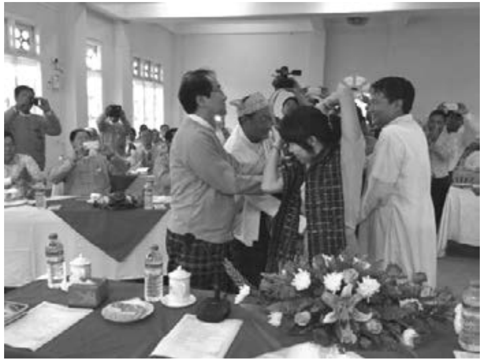
Tsalum (OSC Banmaw)

ဇွန်လ (၂၁) ရက် ၂၀၁၇ သည် ဗန်းမော်ဂိုဏ်းအုပ်ဆရာတော်ရွှေမင်းလွတ်ဂမ်၏ (၆၄) နှစ်ပြည့် မွေးနေ့ကျရောက်သကဲ့သို့ ထိုနေ့သည် ကချင်ပြည်နယ် အစိုးရအဖွဲ့နှင့် တွေ့ဆုံခြင်းမှာလည်း ထူးခြားချက်ပင်ဖြစ်သည်။