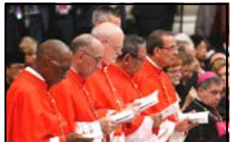
အသင်းတော်အတွက် ကာဒီနယ်အသစ် ငါးပါး ခန့်အပ်ခြင်း